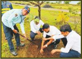
Plantation Drive at Khirvire WPS, Maharashtra