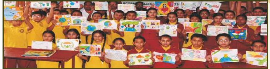
Painting Competition at Luhri HEP-1, HP