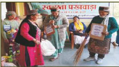
Nukkad Natak at NJHPS, HP