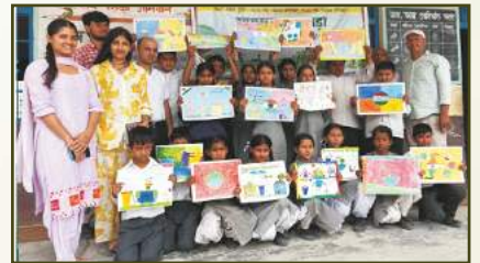
Painting Competition at Sunni Dam HEP, HP