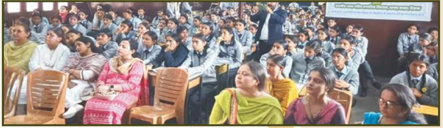
Menstrual Health Awareness Program at Govt. Girls Sr. Sec. School Lakkar Bazar, Shimla, HP