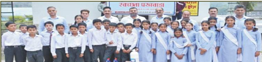
Sanitation Kit for CTU Toilet Maintenance at Rampur HPS, HP