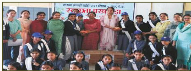
Menstrual Hygiene Awareness at NJHPS, HP