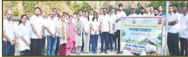
Cleanliness Drive at Sunni Dam HEP, HP