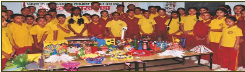
'Best from Waste' Competition at Luhri HEP-1, HP