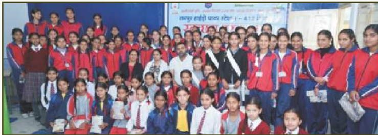
Sanitary Napkins Distribution at RHPS, HP