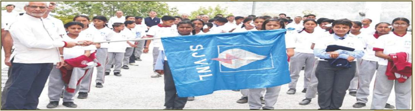
Swachhta Rally at CHQ, Shimla