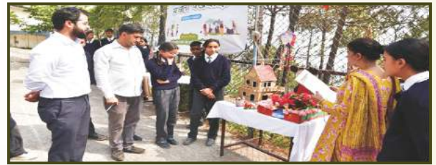
'Best from Waste' Competition at GSSS Beolia, Shimla