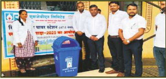
Dustbin Distribution at Khirvire WPS, Maharashtra