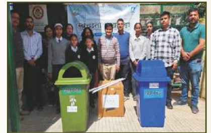
Sanitation Kit for CTU Toilet Maintenance- GSSS, Bhattakufer, Shimla HP