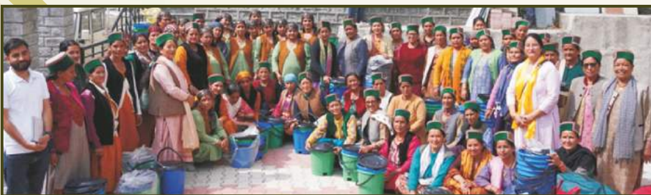
Dustbin Distribution and Awareness Session amongst Mahila Mandals at Nathpa Jhakri HPS, HP