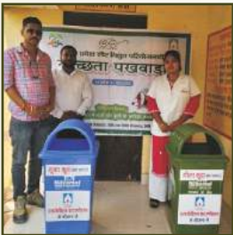
Dustbin Distribution at Uttar Pradesh SPP