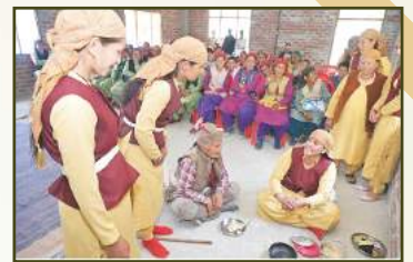
Nukkad Natak at RHPS, HP