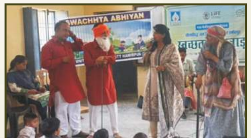
Nukkad Natak at Dhaulasidh HPS, HP