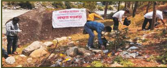
River-cleaning activities at Tons River Bed - Naitwar Mori HPS, Uttarakhand