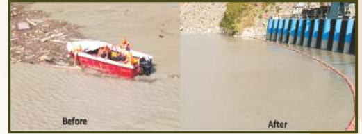
River-cleaning activities at Sutluj River - Nathpa Dam site, Kinnaur (NJHPS, HP)